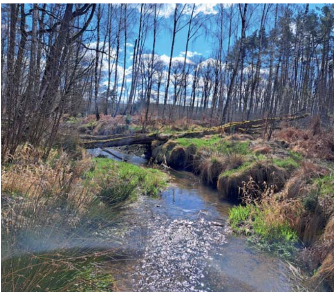
Foto: Ein naturnahes Gewässer mit unterschiedlichem Bewuchs bietet eine große Vielfalt für Lebewesen, aber auch zur Erholung.

Dieser Text entstand in Zusammenarbeit der Fachberaterinnen und Fachberater Gewässer des Landesamtes für Umwelt, Landwirtschaft und Geologie und der unteren Wasserbehörde des Landkreises. ■