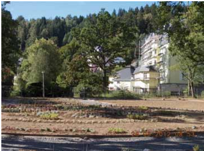
Der Rosengarten am 28.08.2012

Die Saisonbepflanzung Herbst und die Staudenpflanzung erfolgten auf den Ornamentbeeten entlang der Hauptachse bereits Ende August. Die am 21.08. gelieferten Pflanzen mussten innerhalb von 48 Stunden in die Erde. So waren nach Absteckung der Pflanzraster 400 Pflanzen pro Längsbeet und 2280 Pflanzen im Rundbeet zu pflanzen. Es kamen 9 Arten ausdauernde Stauden bzw. bodendeckende Gehölze zum Einsatz, wobei Euonymus fortunei (Kletterspindelstrauch), Aster dumosus – Sorten und Tanacetum parthenium (eine kleinblütige, weiße Chrysantheme) die Hauptrolle spielen. Der Herbstflor besteht aus 13 verschiedenen Arten. Mit Arabis procurrens (Karpatschaumkresse), Calocephalus Brownii (silberfarbener Stacheldraht oder Gitterkraut), Heuchera – Arten (Purpurglöckchen), Sedum Hybriden (Fetthennen) und Senecio Cineraria (Weißfilziges Greiskraut) sind nur die am häu-