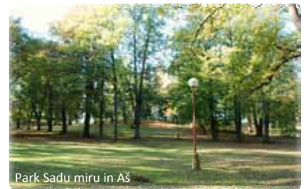
Park Sadu miru in Aš

Von dieser Gesamtsumme fließen 2.149.634 Euro in den deutschen Projektteil und stehen u.a. für die Gestaltung des Rosengartens und des Gondelteichs in Bad Elster zur Verfügung. Die Planungen beinhalten unter anderem die Sanie-