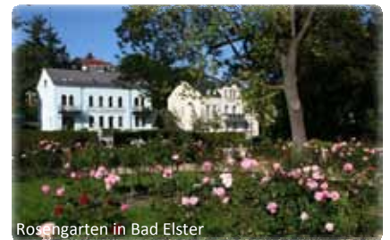
Rosengarten in Bad Elster

In Bad Elster wird der Startschuss im Februar 2012 fallen. Der Bauantrag muss noch in diesem Jahr im Landratsamt eingereicht sein, um auch die notwendigen Abstimmungen mit den Fachbehörden fristgerecht zu gewährleisten. Parallel dazu werden die ersten Ausschreibungen stattfinden. Den Auftakt für die insgesamt zwei Jahre andauernden Maßnahmen bildet die Umgestaltung des Rosengartens nach historischem Vorbild. Dieser soll planmäßig im August 2012 (in Abhängigkeit von der Wetterlage im Bauzeitraum) in neuem Glanz erstrahlen.